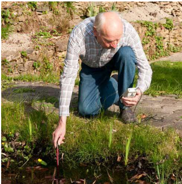
Imagen de uso del medidor de potencial Redox PCE-228R