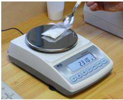
La balanza de precisión PCE-BT 2000 pesando una dosificación