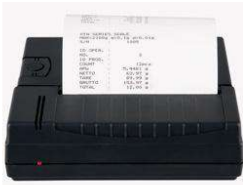
Información impresa como peso bruto, neto, tara, total, peso unitario, etc.