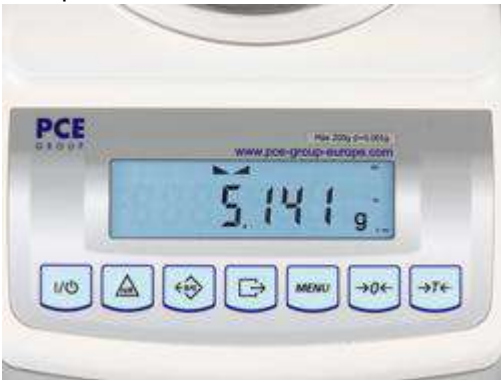
Aquí observa la alta resolución en pantalla de la balanza de precisión PCE-BT 200