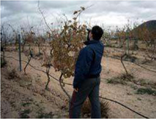
Viticultor realizando una medición de los grados Brix de la uva con el refractómetro.