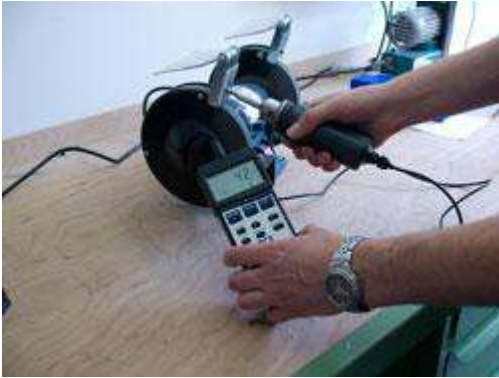
Medidor de torque midiendo el par de apriete en una amoladora.