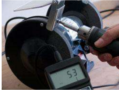
Los valores determinados se pueden leer directamente en pantalla del medidor de torque