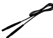
Cable 1,2 m negro 1 kV (conectores tipo banana)