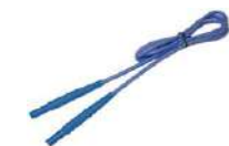
Cable 1,2 m azul 1 kV (conectores tipo banana)