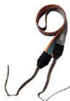
Arnés para el medidor (tipo M1)