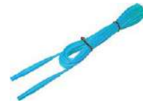
Cable 5,0 m azul 1 kV (conectores tipo banana)