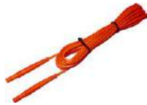
Cable 5 m rojo 1 kV (conectores tipo banana)