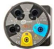
CS-1 - Simulador de cable