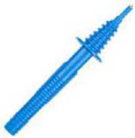
Sonda azul de punta 1 kV (toma tipo banana)