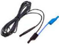
Cable 5 m negro 1 kV (conectores tipo banana, blindado)