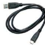
Cavo USB tipo C