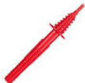
Sonda roja de punta 5 kV (toma tipo banana)