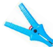
Cocodrilo azul 11 kV 32 A