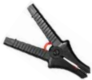
Cocodrilo negro 11 kV 32 A