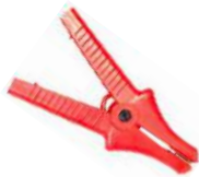
Cocodrilo rojo 11 kV 32 A