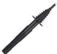
Sonda negra de punta 5 kV (toma tipo banana)