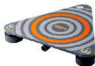
Sonda para medir la resistencia de suelos y paredes PRS-1