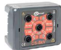
Adaptador caja de calibración CS 5 kV