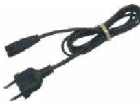
Cable de alimentación 230 V (conector IEC C7)