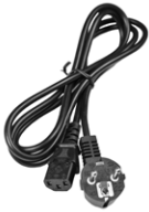
Cable de alimentación 230 V (conector Uni- Schuko/ IEC C13)