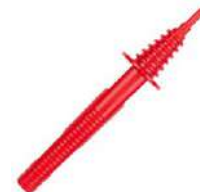
Sonda roja de punta 11 kV (toma tipo banana)