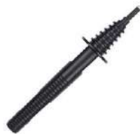
Sonda negra de punta 11 kV (toma tipo banana)