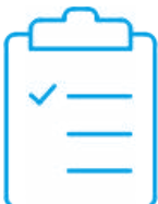
Certificado de calibración con acreditación