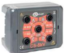
Adaptador caja de calibración 5 kV

WAPRZ003REBB10K WAPRZ005REBB10K WAPRZ010REBB10K WAPRZ020REBB10K