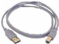
Cable de transmisión, terminado con conector USB