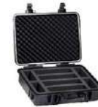
Estuche L2 para pinzas