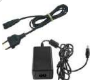
Alimentación Cable de alimentación 230 V (conector IEC C7) WAPRZLAD230 Fuente de alimentación para cargar la batería Z7 WAZASZ7