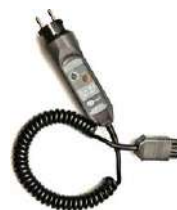
Adaptador WS-03 con botón que inicia la medición (conector UNI-Schuko) (CAT III 300 V) WAADAWS03