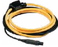
Pinza flexible F-2A (Ø 235 mm)