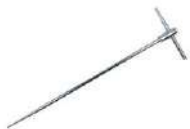
Sonda de medición para clavar en el suelo 80 cm