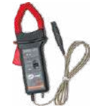
Pinza C-5A (Ø 39 mm) 1000 A AC/DC