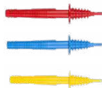
Sonda de punta 1 kV (toma tipo banana) roja / azul / amarilla WASONREOGB1 WASONBUOGB1 WASONYEGB1