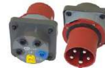
Adaptador para enchufes trifásicos 63 A