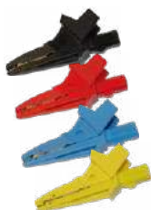
Cocodrilo 1 kV 20 A negro / rojo / azul / amarillo WAKROBL20K01 WAKRORE20K02 WAKROBU20K02 WAKROYE20K02