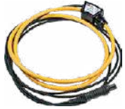
Pinza flexible F-1A (Ø 360 mm)