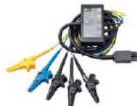
Adaptador AutoISO-1000C para la medición automática de la resistencia de aislamiento de cables multifilares