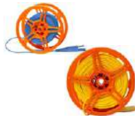
Cable para la medición de puestas a tierra 25 m / 50 m