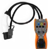
Adaptador para probar estaciones de carga de vehículos EVSE-01