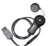
Sonda luxométrica LP-10A con clavija WS06