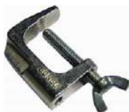
Mordaza (conector tipo banana)