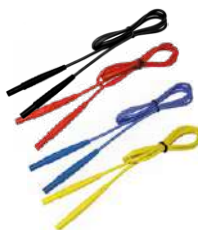
Cable 1,2 m (conectores tipo banana) negro / rojo / azul / amarillo WAPRZ1X2BLBBN WAPRZ1X2REBB WAPRZ1X2BUBB WAPRZ1X2YEBB