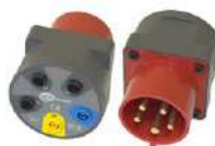
Adaptador para enchufes trifásicos 16 A / 32 A