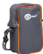
Funda M13 solo para • MPI-540-PV • MPI-540-PV Start WAFUTM13