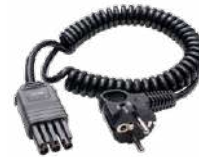
Adaptador WS-04 (conector angular UNI-Schuko)