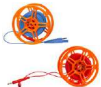
Cable 25 m para medir la toma de tierra en carrete (conectores tipo banana) azul / rojo