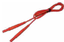
Cable 1,2 m 1 kV (conectores tipo banana) rojo