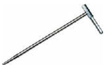
4x sonda de medi- ción para clavar en el suelo (30 cm)