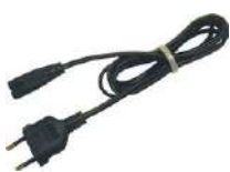
Cable de alimenta- ción 230 V (co- nector IEC C7)