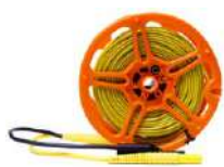
Cable 50 m para me- dir la toma de tierra en carrete (conec- tores tipo banana, blindado) amarillo