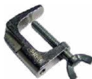
Mordaza (conec- tor tipo banana)