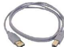
Cable de transmi- sión, terminado con conector USB