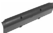
Batería NiMH recargable 4,8 V 4,2 Ah