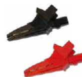
Cocodrilo 1 kV 20 A negro / rojo