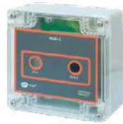
Generador ultrasónico WMGBGUD1