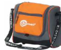
Funda M6 WAFUTM6