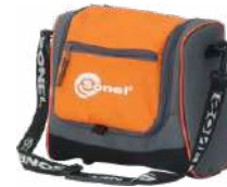
Funda M6 WAFUTM6